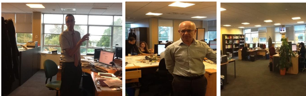
Différents "Desk" de la salle de marchés de la société de gestion Federal Finance.